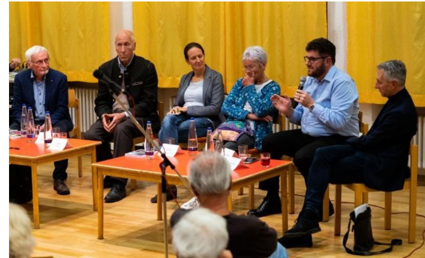
Diskussion zu „Weniger ist Mehr“