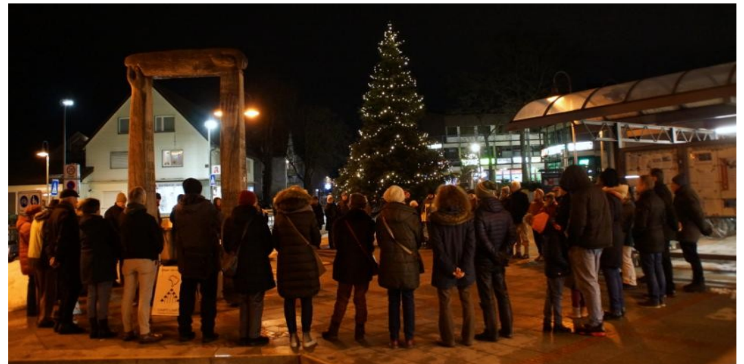
Schweigekreis am Tag der Menschenrechte