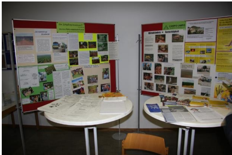
Infostand bei Basar