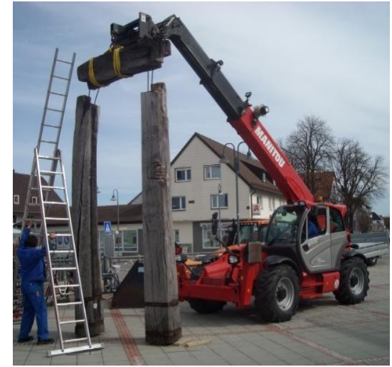
Abbruch am 1.4.2018