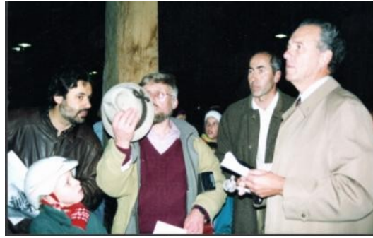
Einweihung am 11.10.1992