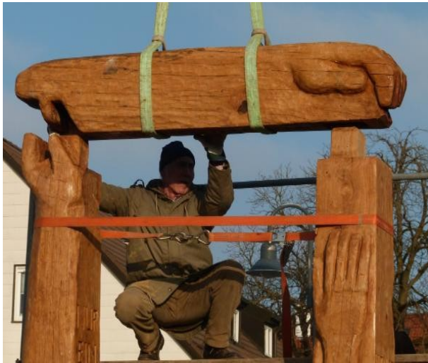
Neuaufbau November 2020